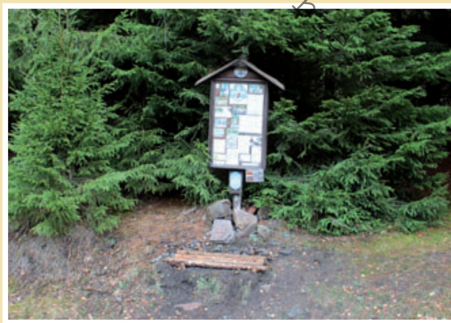
Skautská nástěnka vedle mohyly na Eliáši (2017).