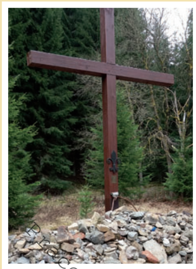
Skautská mohyla Eliáš (2018).

nové byli v politických procesech odsouzeni na mnoho let vězení a byli nasazeni v jáchymovských uranových dolech na nucenou práci. Během Pražského jara byl skauting krátce znovu povolen v letech 1968–1970 a pak opět zakázán. Od roku 1992 se na Jáchymovsku vzpomíná prostřednictvím dřevěného kříže na mohyle Eliáš na skauty zavřené v uranových pracovních táborech a dolech. Naposledy v roce 2013 byl kříž obnoven.