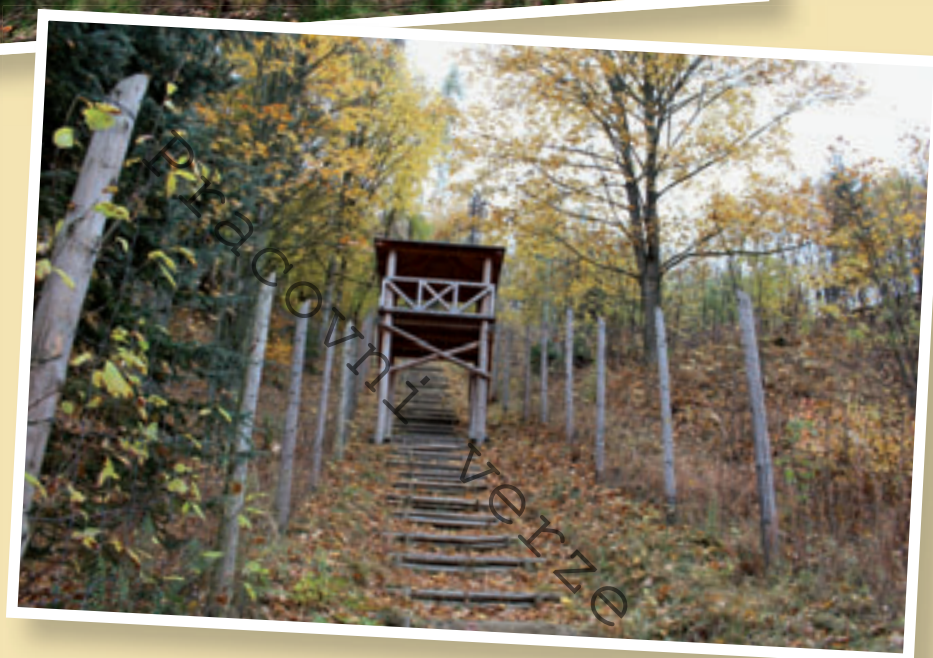
Mauthausenské schody před rekonstrukcí v r. 2014 a opravené schody v roce 2018.