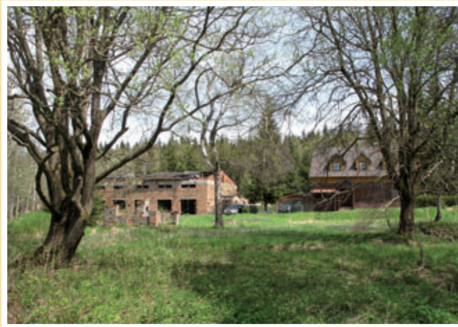
Hornická převlékárna na Rovnosti.