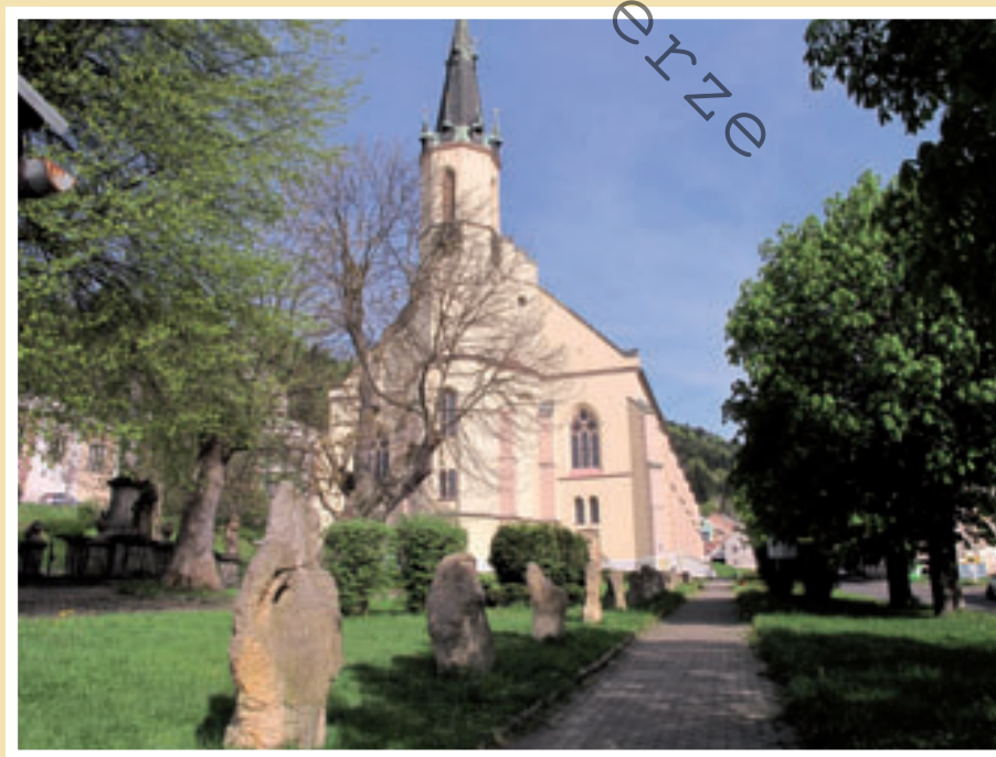
Vzpomínkové místo před kostelem sv. Jáchyma v r. 2015.

U památníku „Křížová cesta ke svobodě“ se každý rok koná vzpomínkový ceremoniál dosud žijících pamětníků z ČR i Slovenska. Od roku 1990 se zde muklové setkávají vždy poslední květnovou sobotu s politickými představiteli a zástupci médií při vzpomínkové bohoslužbě v kostele a následujícím ceremoniálu, který se nazývá „Jáchymovské peklo“. Při této příležitosti se k památníku kladou věnce, hraje vojenská hudba a pronáší se politické projevy v duchu hesla „vzpomeňme a nezapomeňme“. Z tohoto důvodu Jáchymov