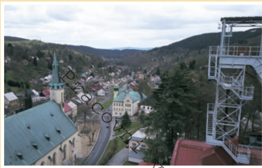
Pohled na Jáchymov (2018).

ve městě se tento počet přiblížil někdejší slávě stříbrného města. Rozdíl spočíval v trochu modernějších těžebních postupech a také v tom, že většina jáchymovských horníků zde po r. 1939 těžila uran a nikoli blyštivý mincovní kov. Šlo často (ale zdaleka ne výlučně) o horníky z donucení, válečné, retribuční, kriminální a politické vězně, kteří obývali zdejší trestanecké lágry pod pohrůžkou zastřelení. Během druhé světové války a zejména krátce po ní se začala psát nechvalně známá kapitola jáchymovského gulagu s až dvanácti trestaneckými pracovními tábory při uranových dolech. Otrocké lágry a polovojenské pásmo bohužel slávu a zajímavost města a okolí na dlouho zastínily a odřízly od už tak hodně pokřiveného vývoje v ostatním pohraničí.