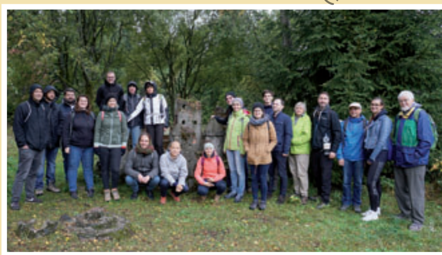
Čeští a němečtí účastníci zapojení do projektu „Learning from the Past: How to Mediate Historical Topics in Civic Education“ (2019).