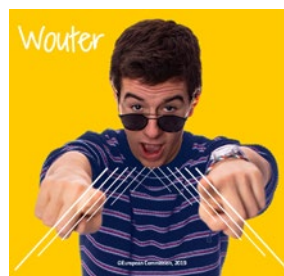
DEMOKRACIE JE NAŠE!