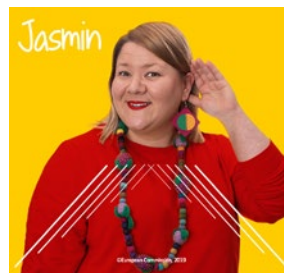
DEMOKRACIE POTŘEBUJE HLASY!